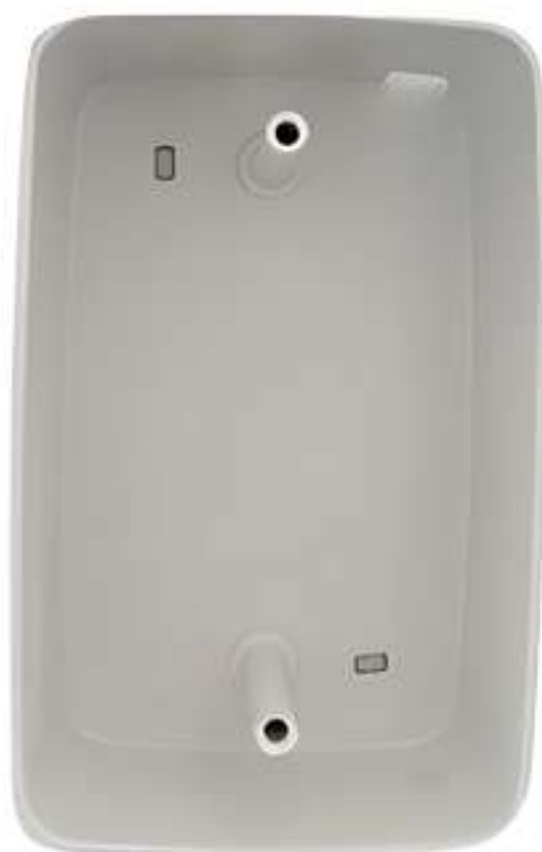
Caixa de passagem alta