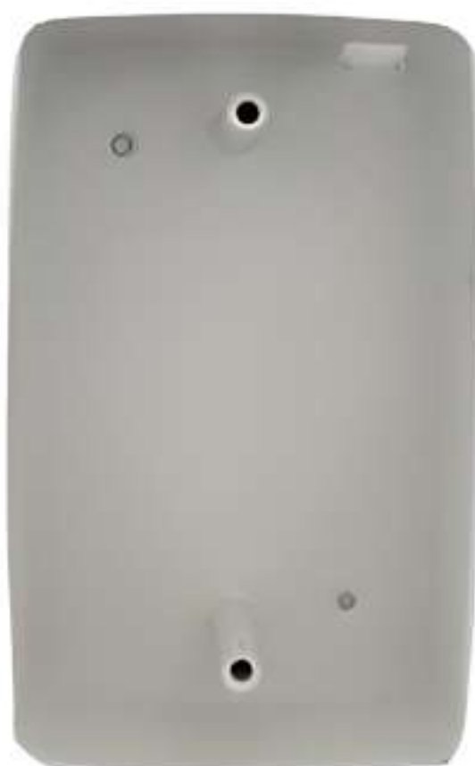
Caixa de passagem baixa